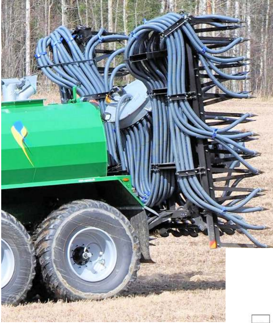
Kuljetusasento on kompakti, siipien taitto on automatisoitu.

AGRONIC -veitsimultain mahdollistaa lietteen levittämisen kasvukaudella suoraan kasvustoon. Ravinnehäviöt ja hajuhaitat pysyvät pienenä ja lietteen levitysaikaa voidaan jatkaa.