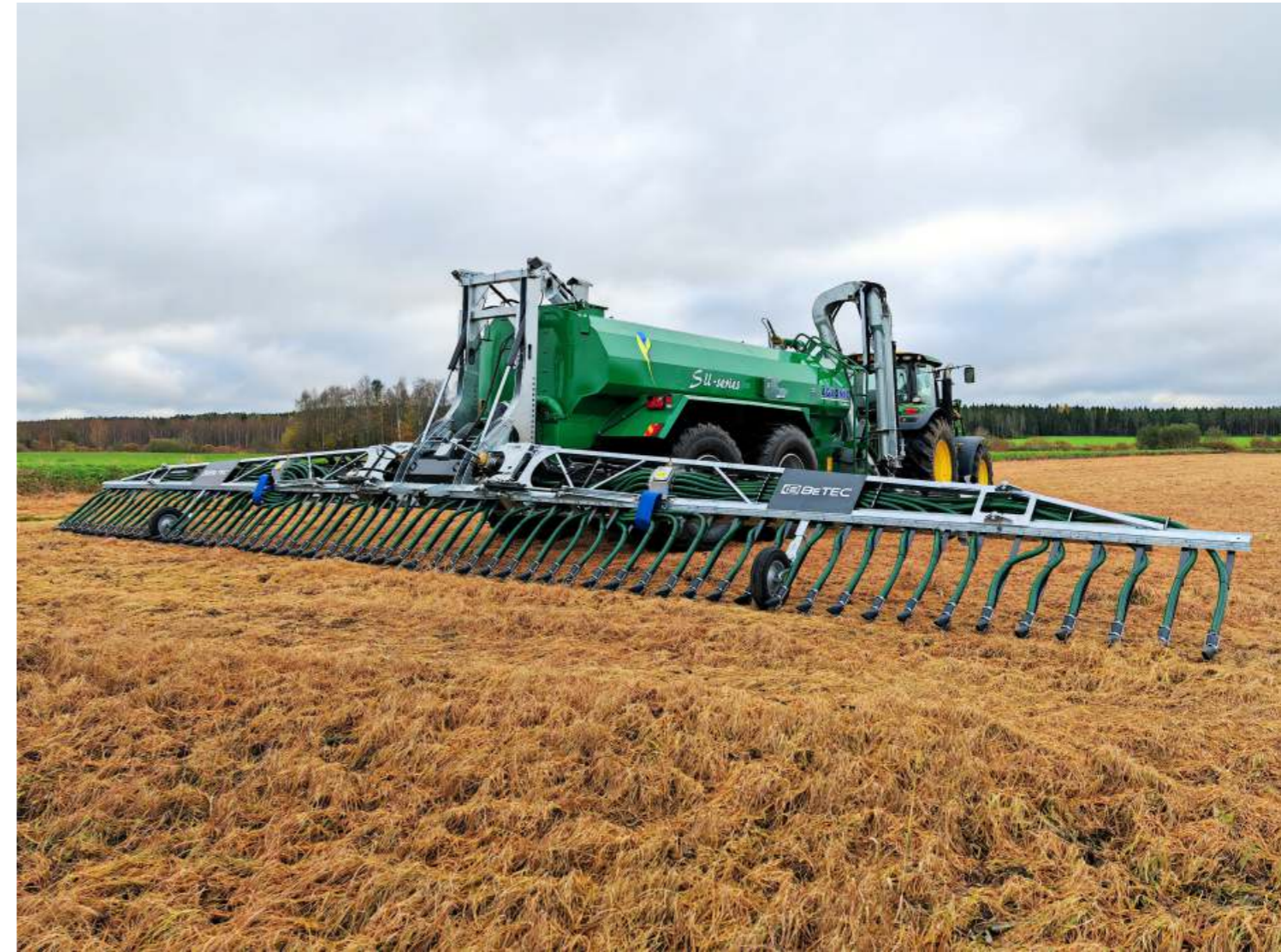
Kuvissa BeTEC L-Line 15.2 Agronic Edition kytkettynä Agronic S II vaunuun.