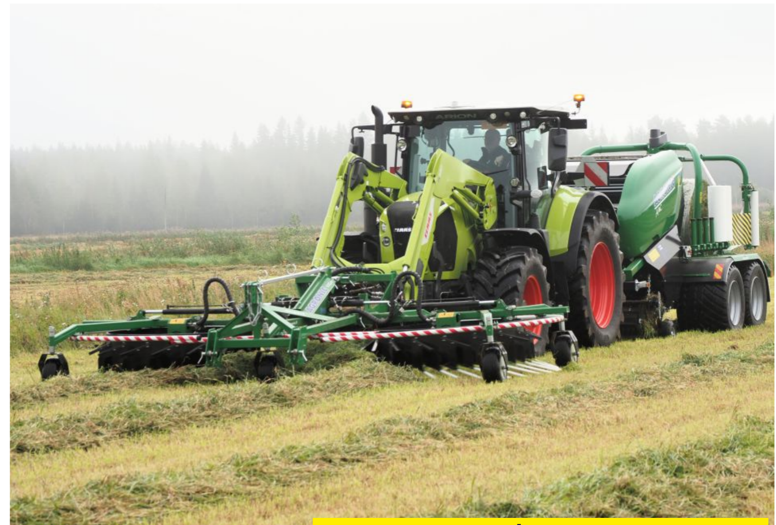
Sovitteet molempiin suuntiin

WR600 tulee etukuormainkäytössä lähelle traktoria. Lisäksi se toimii sovittein myös traktorin takana kolmipistekiinnitteisenä tehokkaana karhottimena. Samassa koneessa voi olla sovitteet molempiin suuntiin.