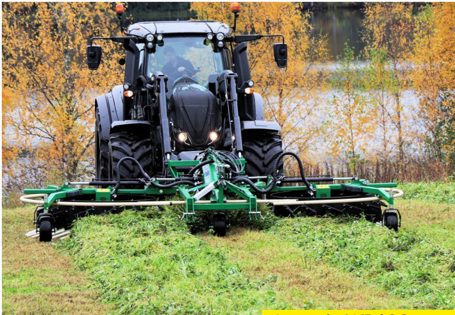
Agronic WR600 evo