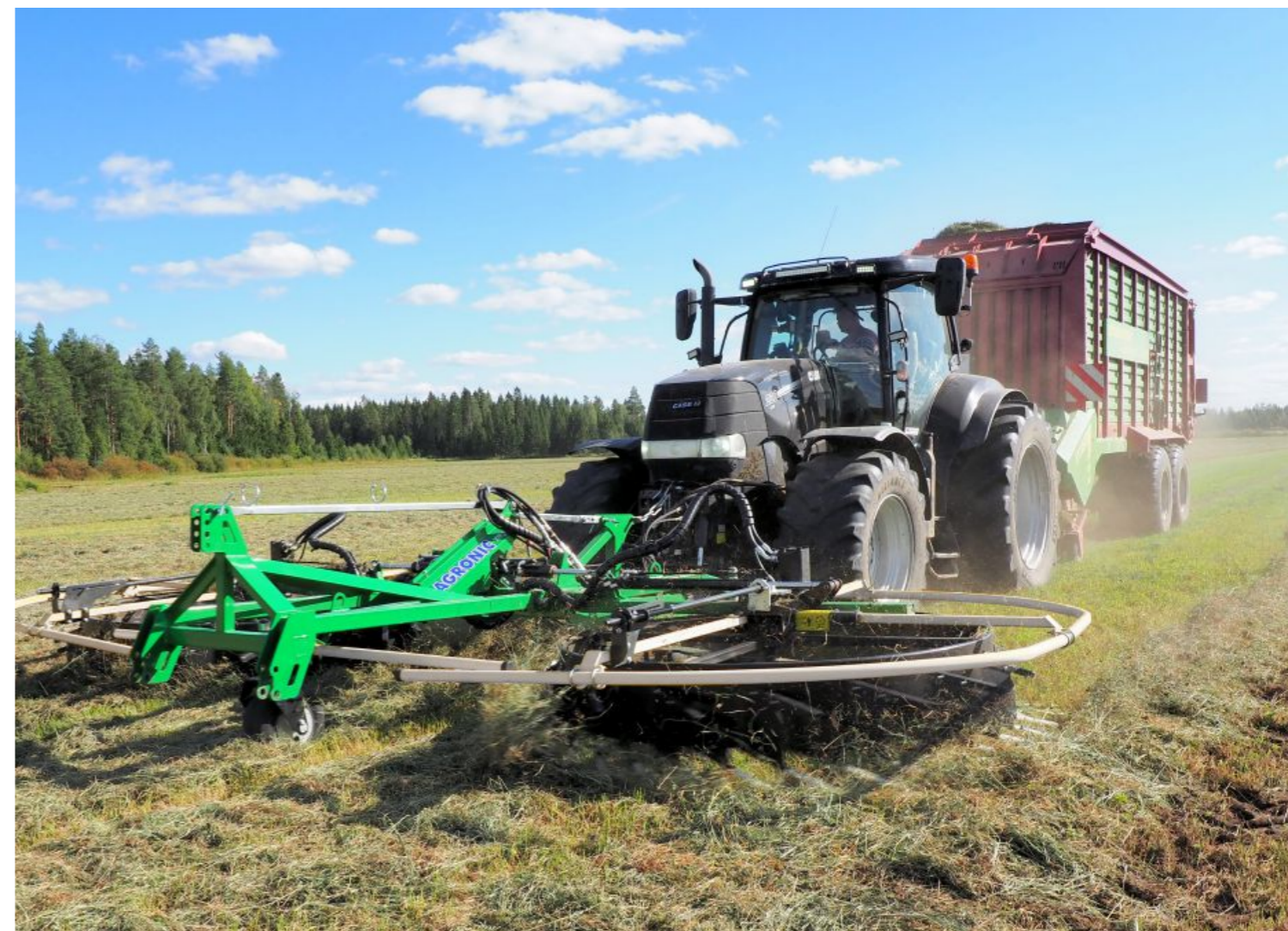
Suurin ja tehokkain