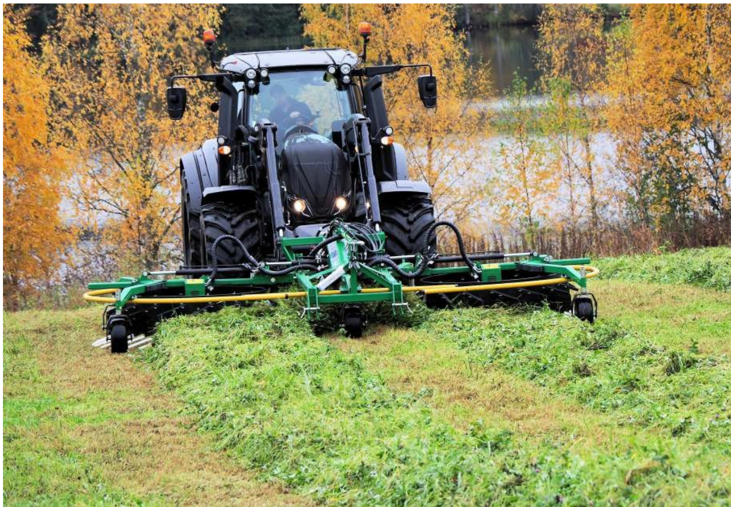
Валкообразователь WR600 evo