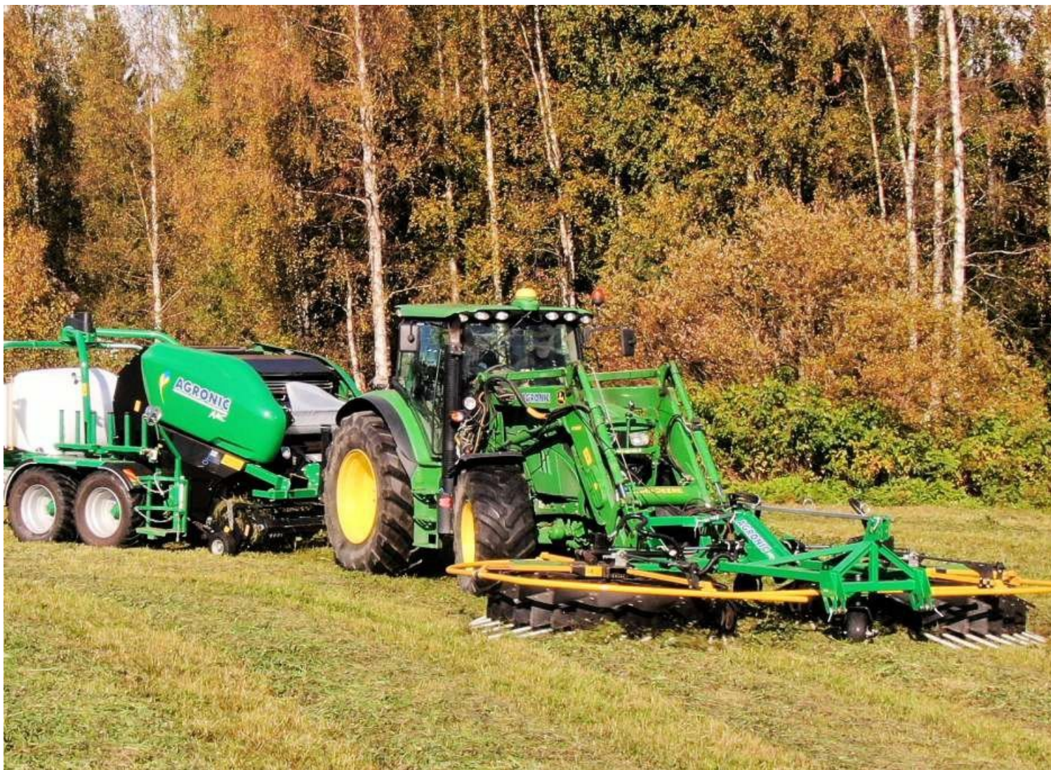
Валкообразователь Agronic WR700