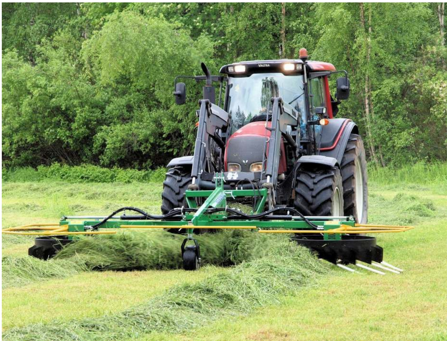
Валкообразователь Agronic WR500